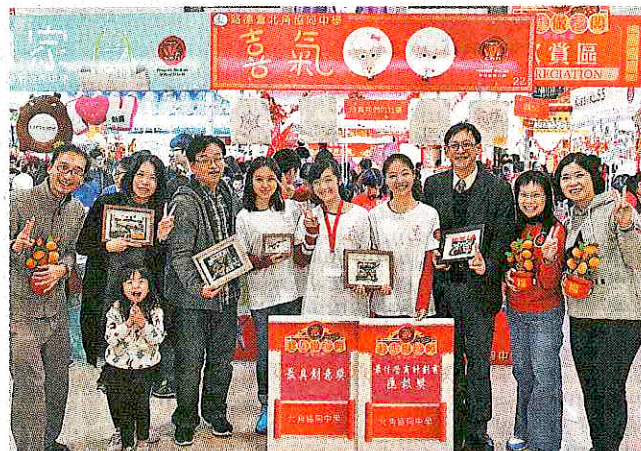
年宵攤位行股東制，學生學到營銷之外，還學到股票市場的運作，手中的拼貼相獲得了最具創意獎。

「自幼捱過窮，早已明白要脫貧就必須用功讀書，小學時有幸遇到好老師，義務幫我補課，令我順利通過升中試，當時就