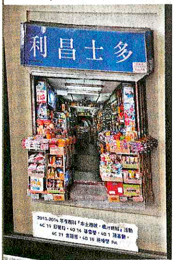
商戶計劃與老舖合作，校方送贈商戶立體拼貼相，極富特色。