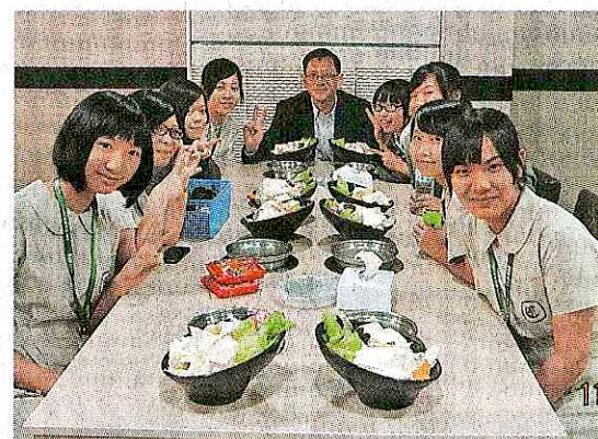
校長希望老師做到像學生的第二父母，他也以身作則，請同學打邊爐。