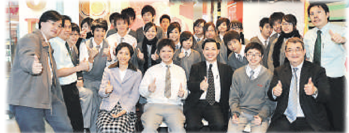
▲「商界展潛能」活動中，師生們參觀一間跨國連鎖餐廳後拍照留念。