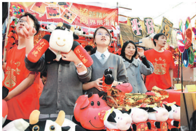
▲北角協同中學師生正努力推銷年貨

學校透過上述不同形式的活動來鞏固學生所學，活化知識，拓闊視野，培養學生的創業精神、領導才能和團隊合作，亦啟發及提高學生對未來工作世界的興趣，加深他們在工作中良好價值與態度的培育，為未來的前途及早作出計劃和準備。