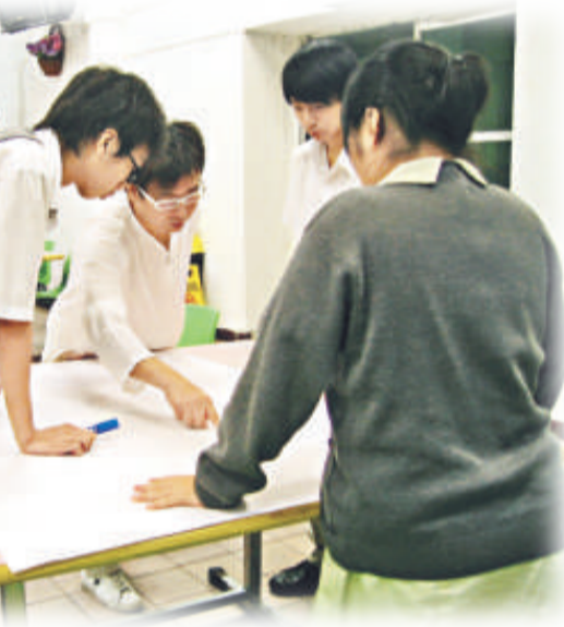
▲「少年MBA計劃」學生正進行小組匯報